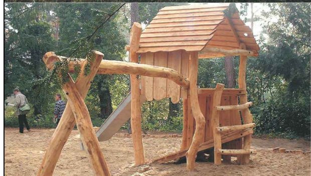
RUTSCHENTURM MIT VOGELNEST-SCHAUKEL