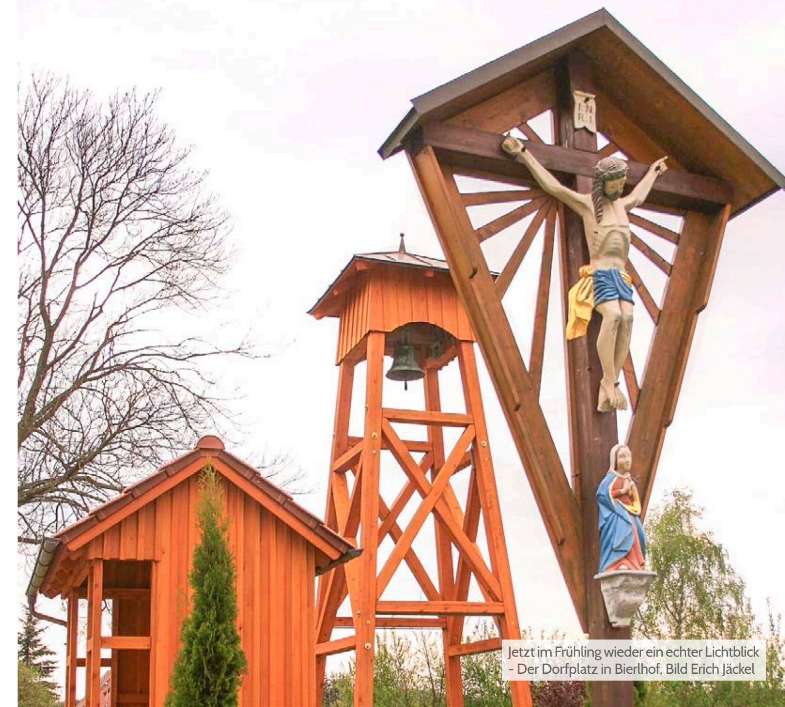
Jetzt im Frühling wieder ein echter Lichtblick - Der Dorfplatz in Bierhof.