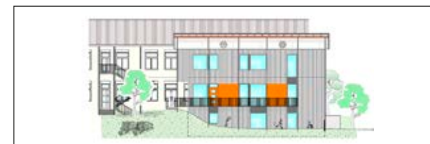
Ansicht Neubau vom Kalvarienberg (Westen):