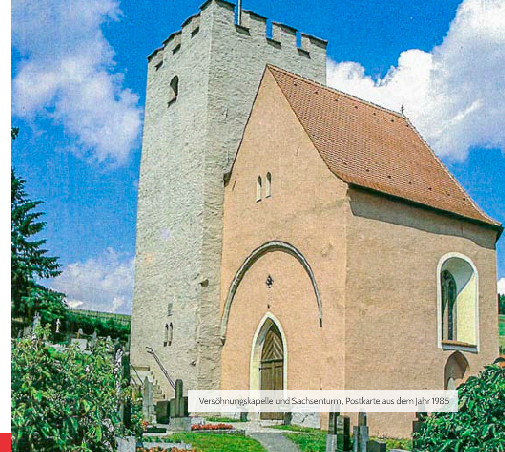
Versöhnungskapelle und Sachsenturm, Postkarte aus dem Jahr 1985