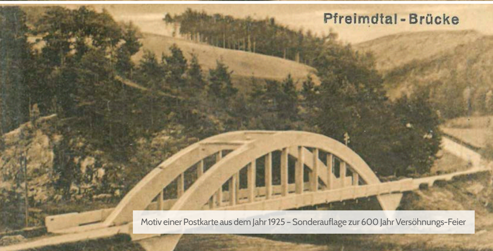
Pfreimdtal - Brücke

Motiv einer Postkarte aus dem Jahr 1925 – Sonderausgabe zur 600 Jahr Versöhnungs-Feier