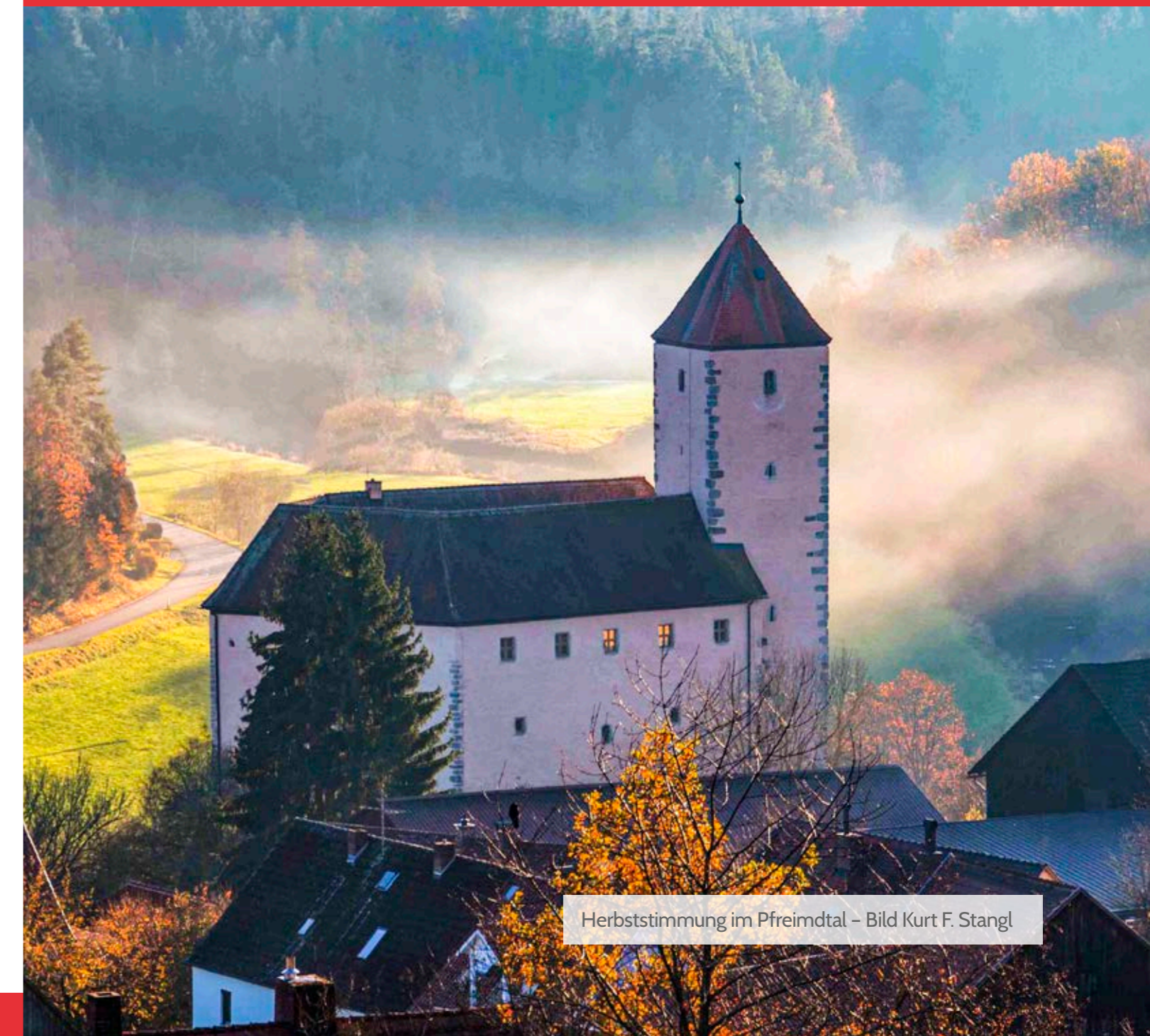
Herbststimmung im Pfreimdtal