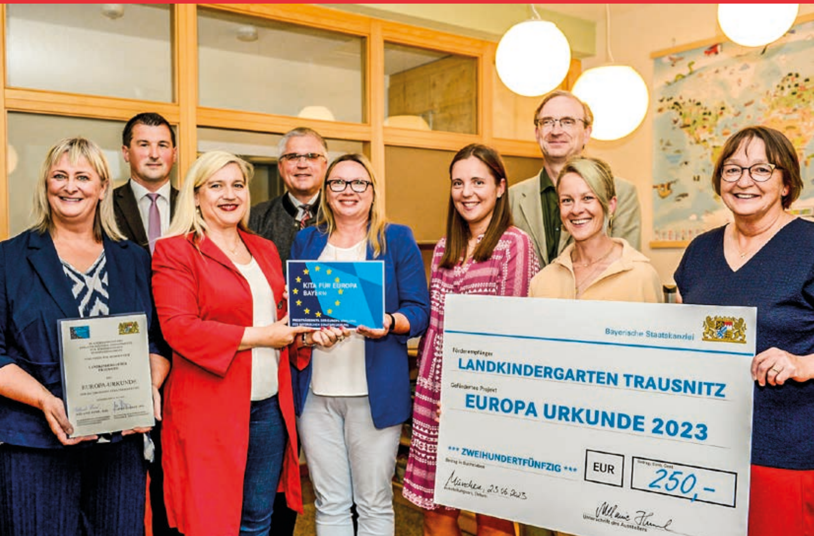
Verleihung der Europaurkunde an den Landkindergarten durch Staatsministerin Melanie Huml